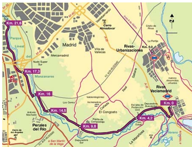
PLANO RUTA VILLAVERDE - RIVAS

La laguna se encuentra en el margen izquierdo del río Jarama antes de su confluencia con el Manzanares, a unos 560 m de altitud. De forma alargada, con su eje mayor en dirección Este-Oeste, con 1.500 m de longitud y 400 m de anchura máxima, está situada sobre la llanura aluvial del Jarama en depósitos formados por arcillas grises, margas yesíferas y yesos.